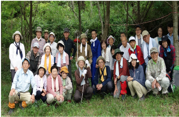
令和元年7月6日撮影

活動日：6月26日（土） 集合時間：午前10時00分 集合場所：作業場所（小雨決行） ※雨天中止※